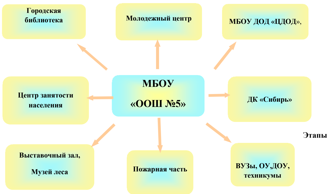
Схема «Социальные партнеры школы»

Целенаправленная социальная деятельность обучающихся обеспечивается сформированной социальной средой школы и внутренним укладом школьной жизни.